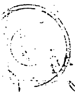
الصفحة الثانية من كتاب ملقطات الخصال للقطب الراوندي الذي معه كتاب الدعوات ، ويظهر عليها تملك المحدث النوري مع خاتمة الشريف

سلمان فارسی روایت کرد از حضرت امام موسی که در شب اول یازدهم یکصد بار در وقت دو رکعت در هر رکعت یکصد مرتبه صلوات بخواند و آخر دعوتی که در آن روز خوانده که کون یا کنان روزی که قلم ناسر ساعه و بیست بار در ایام شصت و نوبت بسیار است و از امام معصوم علی موسی رضا در شب اول رجب چهار رکعت خاتمه رجب بیرون بر نماز منتهی بر آن باشد و هر چه میگذردم بر آنست و بر آنست